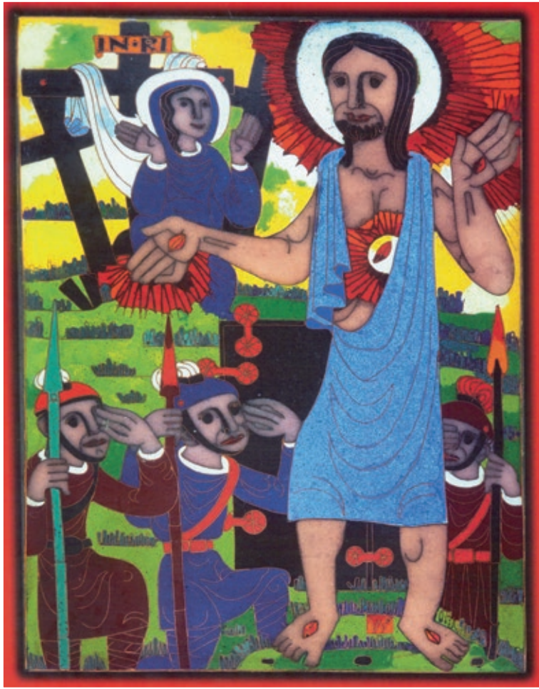
Auferstehung · Eginò G. Weinert

Jesus Christus spricht: Ich lebe und ihr sollt auch leben. (Joh. 14,19)